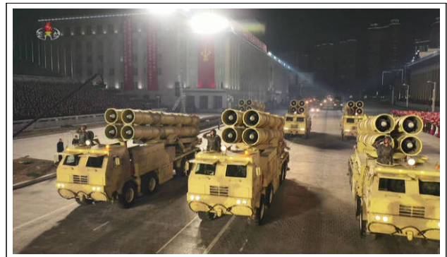
〈그림 1〉 북한의 조선노동당 제8차 대회 기념 열병식에서 공개된 4연장 방사포 22)

한국이 이러한 위협에 대응하기 위해서는 한국형 아이언돔이 필요하다. 장사정포를 요격하기 위해서 여러 장소에 동근 지붕 형태의 방공망을 만들 필요가 있는 것이다. 21)