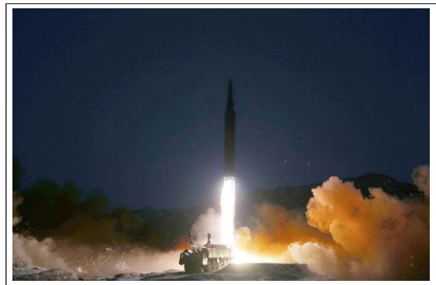
〈그림 3〉 북한이 2022년 1월 조선중앙TV로 공개하면서 대성공했다고 보도한 극초음속 미사일 의 시험발사 장면 26)

현재 한국이 개발하고 있는 한국형 아이언돔은 북한이 발사할 수 있는 장사정포와 방사포의 위협에 대응하기 위한 것이다. 북한이 서울과 수도권을 직접적으로 겨냥하여 단시간에 집중적으로 다량의 장사정포와 방사포를 발사하게 되면 피해는 상상할 수 없을 정도로 크게 된다.